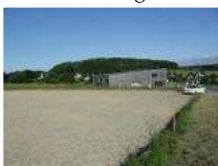
Un vaste terrassement, sur la parcelle au-dessus de Ménerpôle

L'année prochaine, avec six chaufferies dans nos bourgs, nous consommerons plus de 1000 t de bois en année pleine. La filière bois énergie monte en puissance, dans les communes et au niveau de la communauté. Une plateforme pour 800 t, à Langourla, destinée à l'alimentation directe de Collinée et de Langourla, et les autres en stockage d'opportunité.