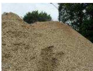
A Collinée, un tas de 1500 m 3 de plaquettes

La construction du bâtiment de la chaufferie et de son silo, enterré derrière est maintenant largement entamée. On commence à y croire : cela devrait chauffer cette hiver, si les intempéries ne viennent pas se mettre en travers.