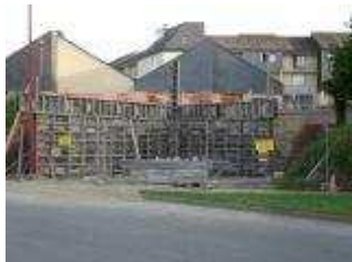
A Collinée, ça pousse !