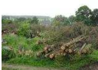
et 250 t de bois abattu à Plénée-Jugon

L'année prochaine, avec six chaufferies dans nos bourgs, nous consommerons plus de 1000 t de bois en année pleine. La filière bois énergie monte en puissance, dans les communes et au niveau de la communauté. Une plateforme pour 800 t, à Langourla, destinée à l'alimentation directe de Collinée et de Langourla, et les autres en stockage d'opportunité.